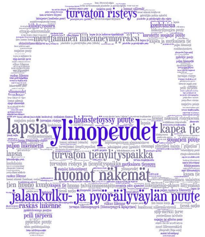
Asukaskyselyn sanapilvi (koko seudun vastaukset)