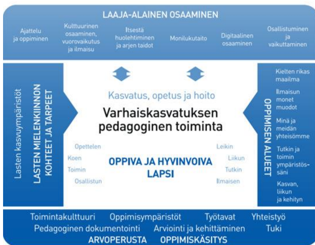
Kuvio 1. Pedagoginen viitekehys (Opetushallitus, 2022)

Varhaiskasvatuksen pedagogista toimintaa ja sen toteuttamista kuvaa kokonaisvaltaisuus. Tavoitteena on edistää lasten oppimista ja hyvinvointia sekä laajaalaista osaamista (kuvio 1).