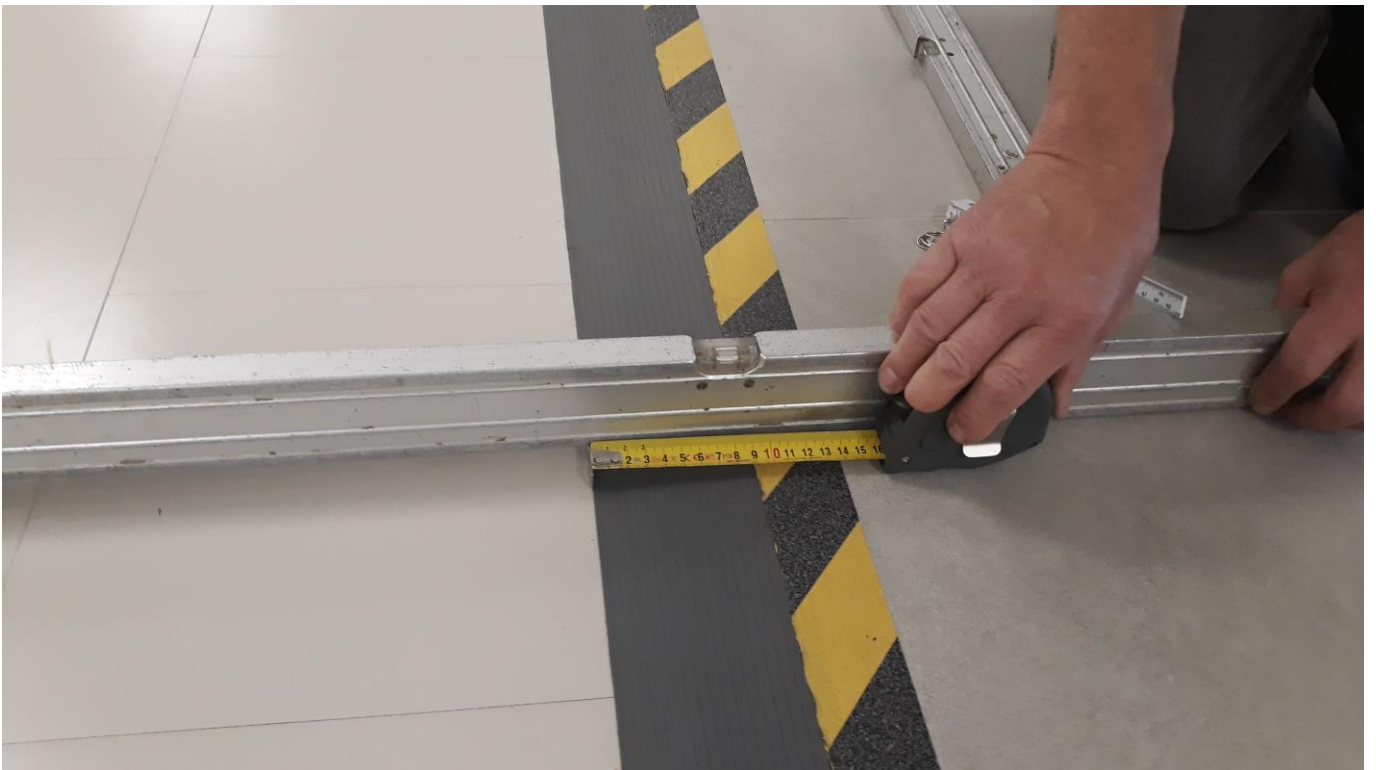
kiilalista 90 mm