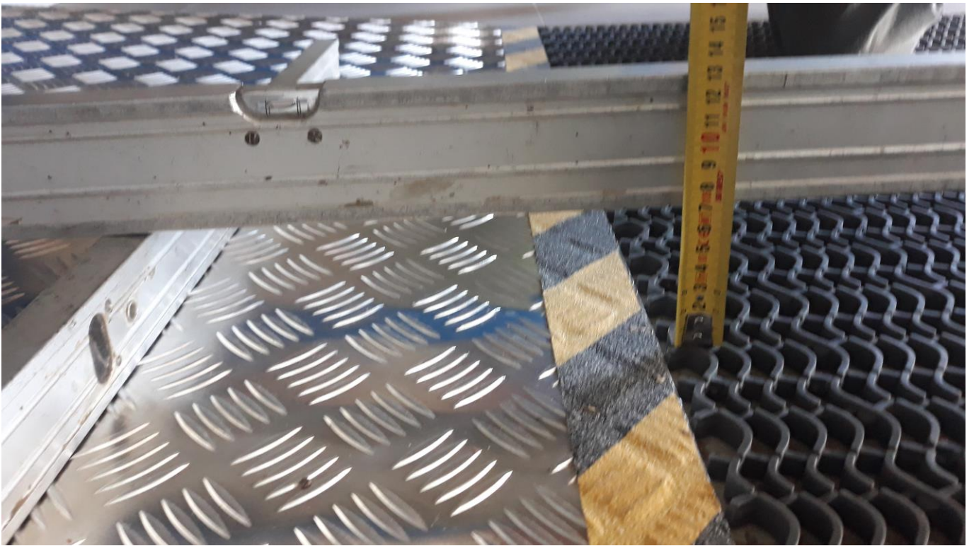
luiskan korkeusero 70 mm