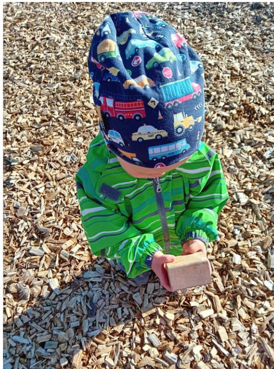
Pihan aarteita, palikka on toiminnut mm kännykkänä.