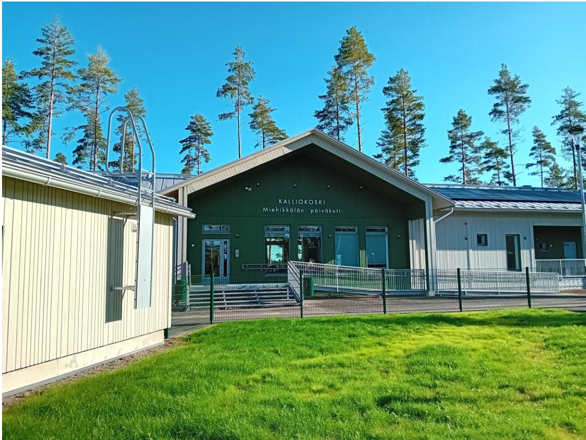
Kalliokoskentie 58, 49750 Kalliokoski

Kalliokosken varhaiskasvatustilat sijaitsevat Pitkäkoskella, vasta valmistuneessa (09/23) uudessa päiväkodissa. Toiminta uudessa päiväkodissa alkoi 11.9.2023.