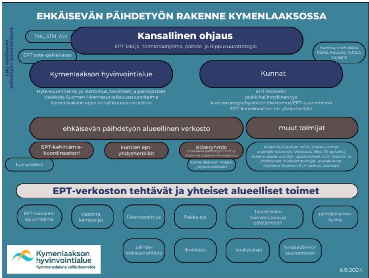
Kuva 2. Kymenlaakson ehkäisevän päihdetyön malli 2024.