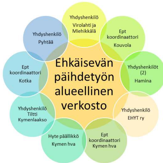
Kuva 3. Ehkäisevän päihdetyön alueellinen verkosto 2024.

Kaikissa Kymenlaakson kunnissa on nimettynä ehkäisevän päihdetyön yhdyshenkilöt (Hamina, Pyhtää, Virolahti ja Miehikkälä) tai ehkäisevän päihde- ja mielenterveystyön koordinaattorit (Kouvola, Kotka). Ehkäisevän päihdetyön yhdyshenkilöt ja -koordinaattorit kehittävät ja toteuttavat ehkäisevää päihdetyötä ja päihdehaittojen ehkäisyä omassa kunnassaan yhteistyössä eri toimijoiden kanssa. Jokaisessa kunnassa toimii monialainen ehkäisevän päihdetyön työryhmä.